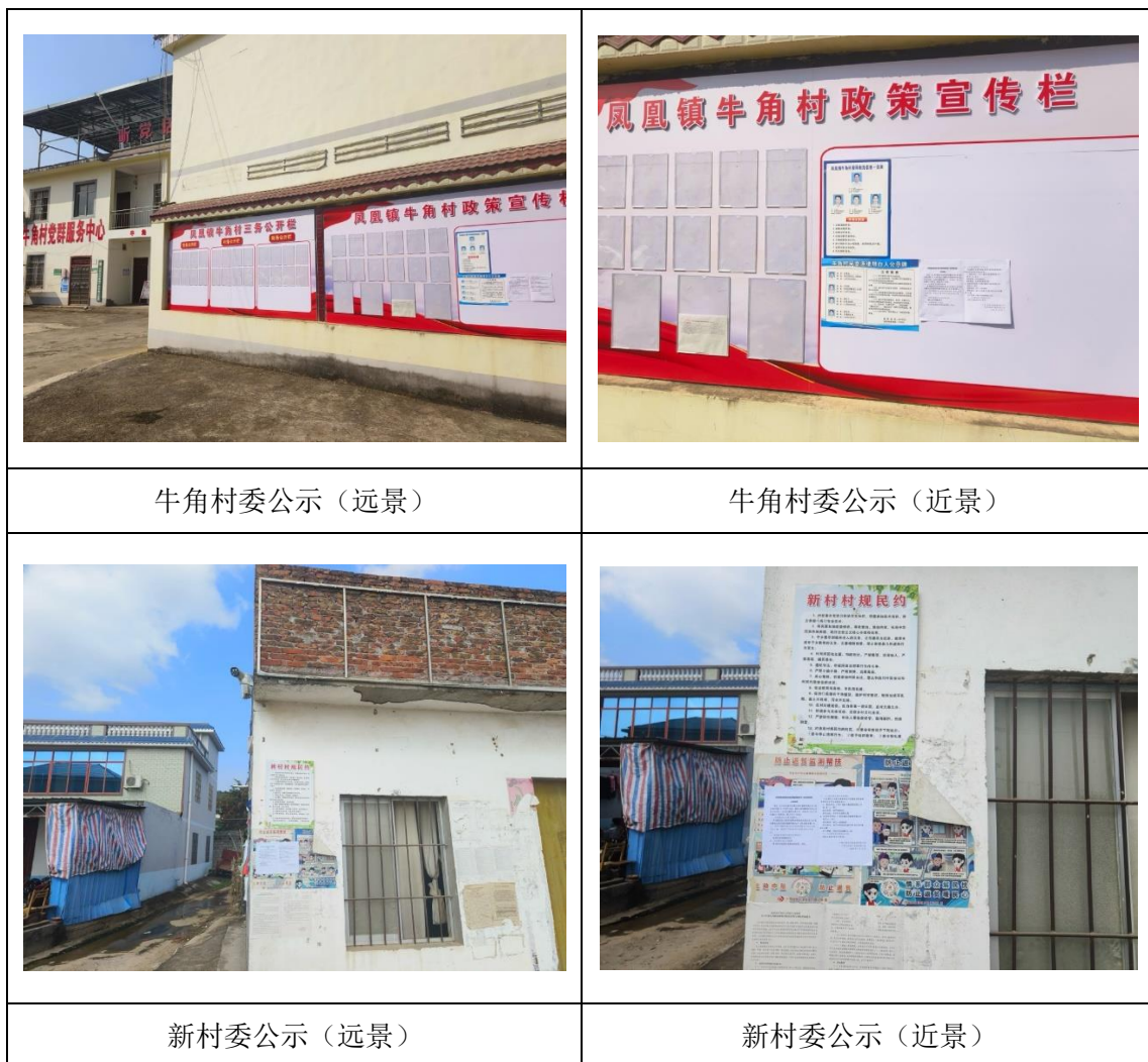
图5 本项目环境影响报告书征求意见稿现场张贴公告照片