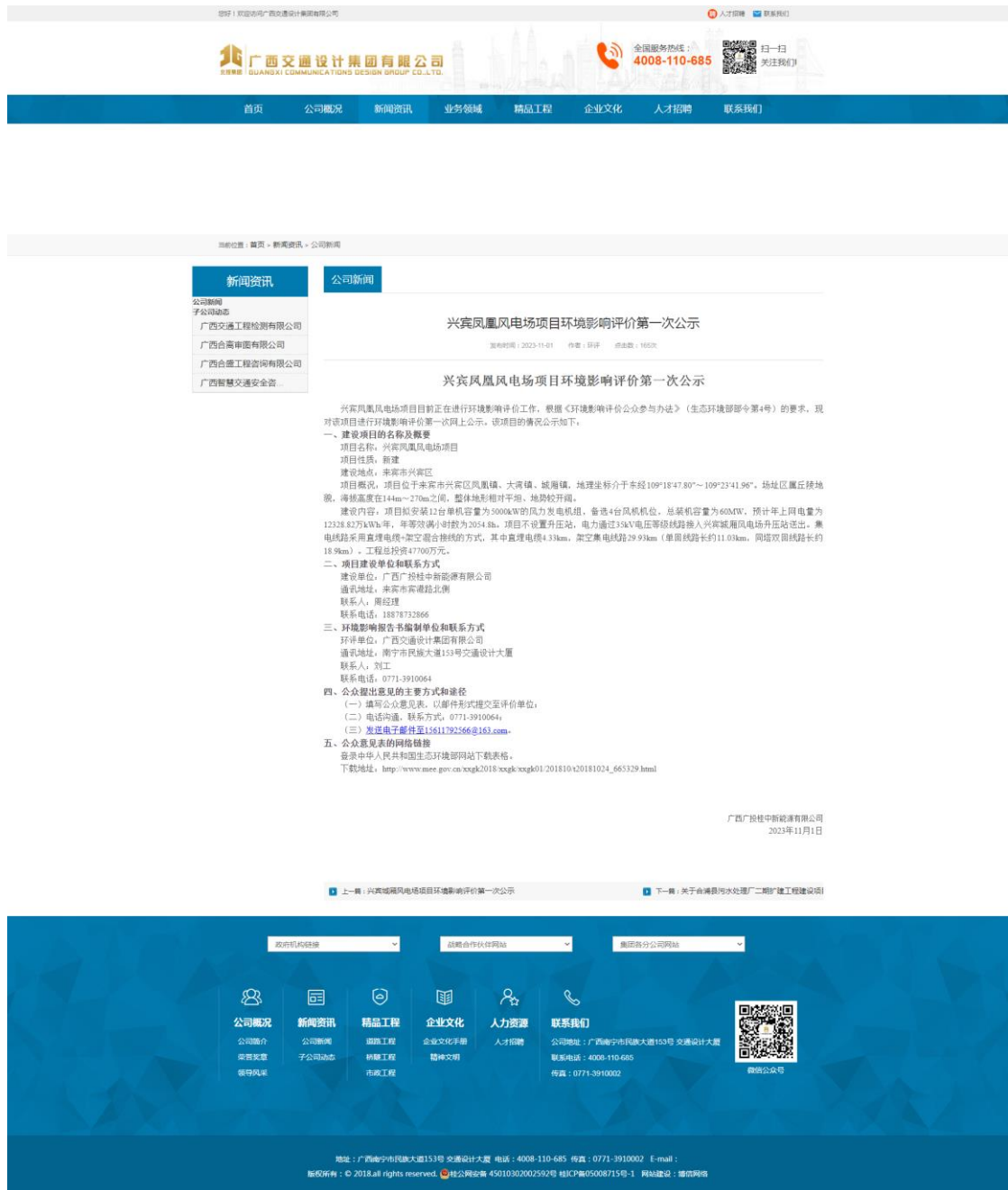
图1 本项目第一次环境影响评价信息网上公开截图