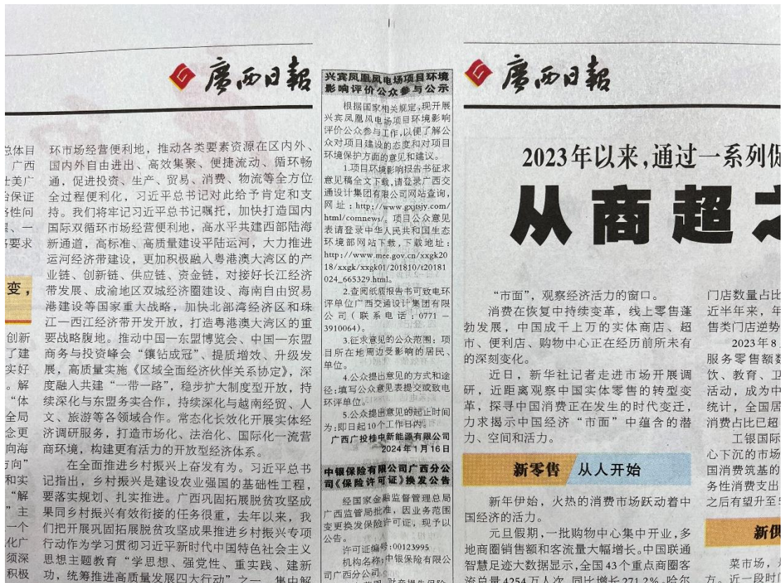
图4 本项目环境影响报告书征求意见稿报纸公示照片（第2次）