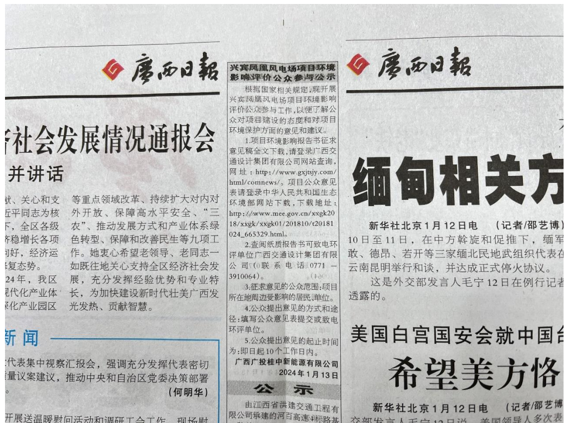
图3 本项目环境影响报告书征求意见稿报纸公示照片（第1次）

别在广西日报上公示了本项目的环境影响报告书征求意见稿的相关信息，登报公示照片见图3、图4。