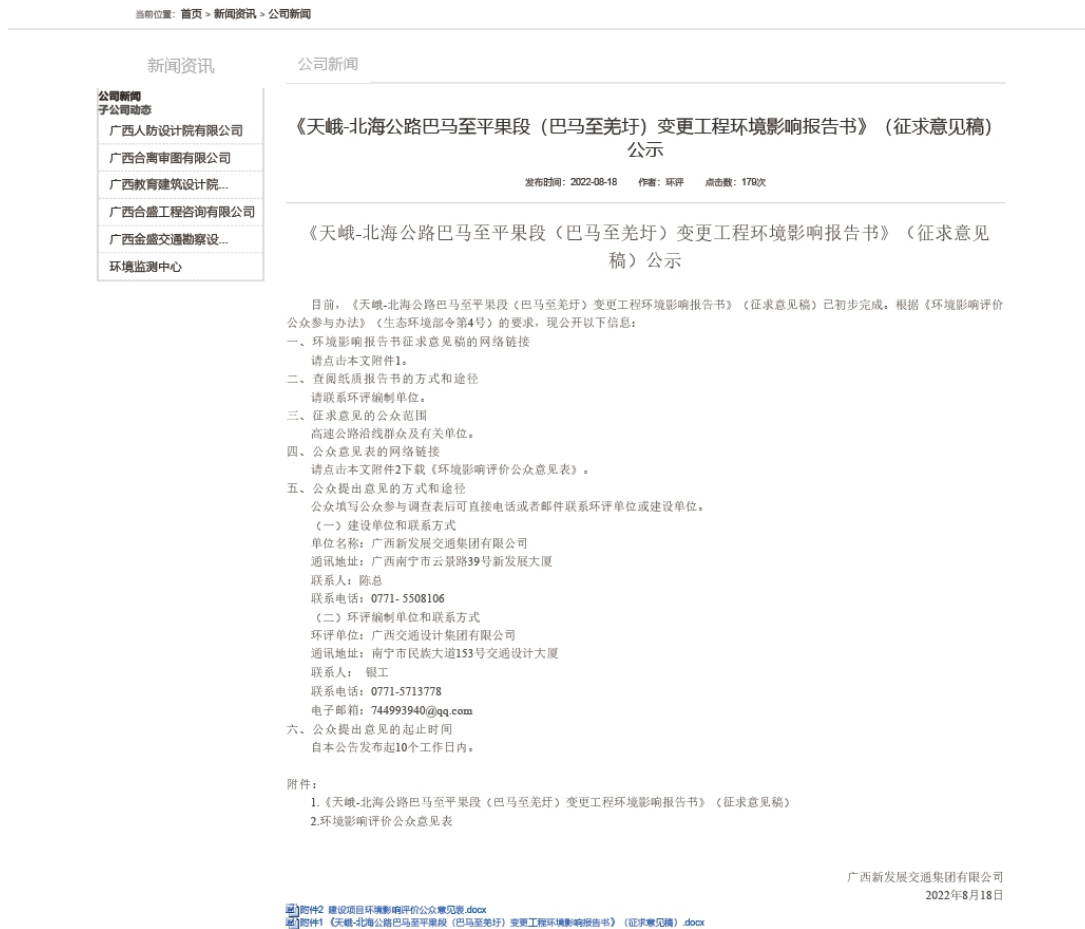
图 2 本项目环境影响报告书征求意见稿网上公示截图