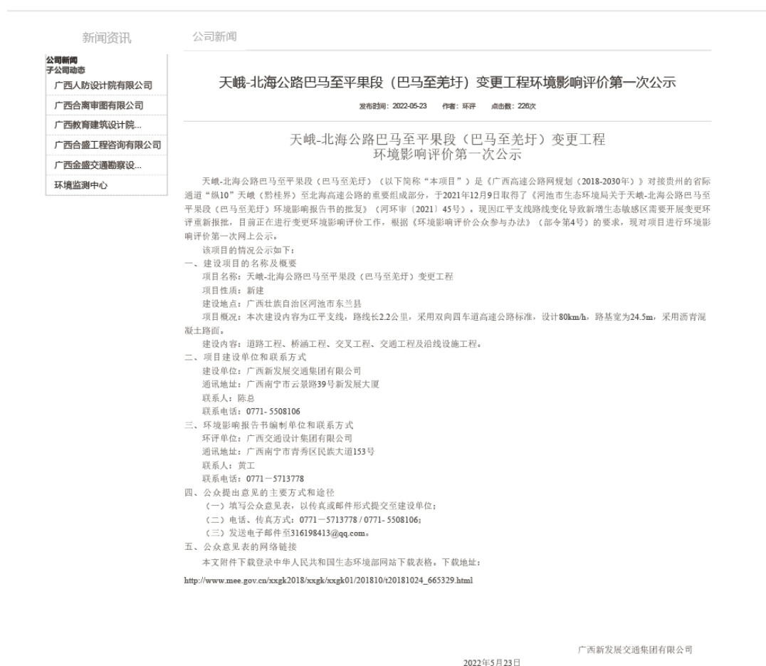
图 1 本项目首次环境影响评价信息网上公开截图

我单位在广西交通设计集团有限公司网站上公开了本项目的首次环境影响评价信息，公开信息截图见图 1。