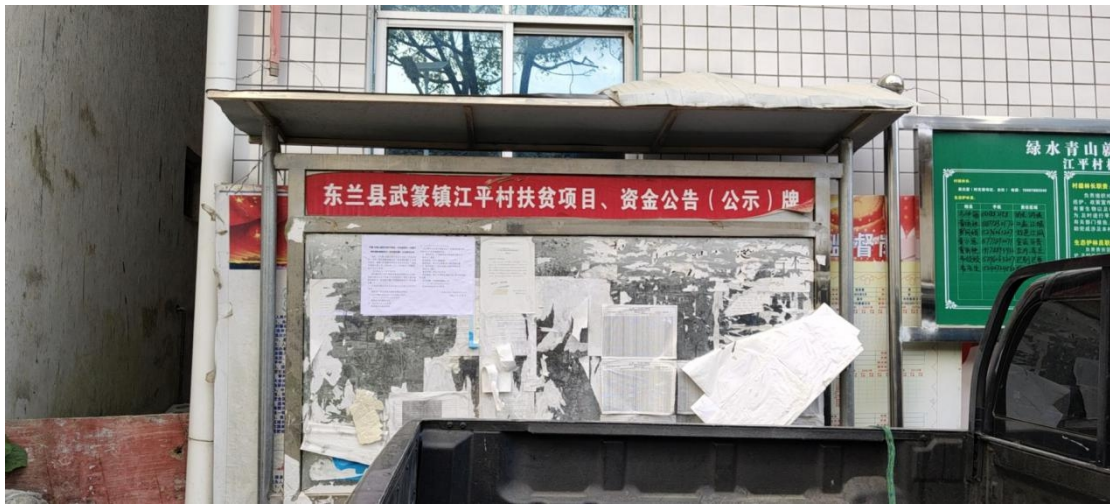
图5 本项目环境影响报告书征求意见稿现场张贴公告照片

我单位于2022年8月25日在本项目所在地东兰县武篆镇江平村村委张贴了公告，张贴公告的现场照片见图5。